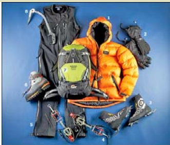
Šta odabrati? Jeftino, kvalitetno, funkcionalno!

Danas u Zagrebu imamo nekoliko specijaliziranih trgovina u kojima je izbor stvarno kvalitetan. Vrhunac i Iglu sport svakako su vodeći u segment opreme koji trebaju svakom planinaru. Od užeta, klinova, karabinera (sponki), zamki, hlača, majici, cipela, čarapa do nasušno potreb-