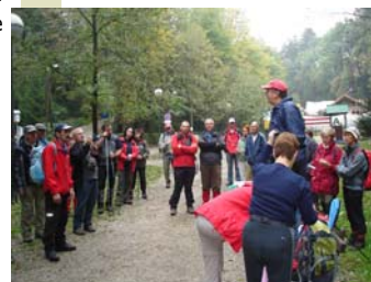
Okupljanje za Dan planinara na Dubravkinom putu

Naznake vrhovnog sportskog tijela HOO-a nisu dobre niti za iduću godinu u kojoj je najavljeno dodatno smanjenje prihoda sredstava za sport.