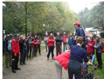
Okupljanje za Dan planinara na Dubravkinom putu

Naznake vrhovnog sportskog tijela HOO-a nisu dobre niti za iduću godinu u kojoj je najavljeno dodatno smanjenje prihoda sredstava za sport.